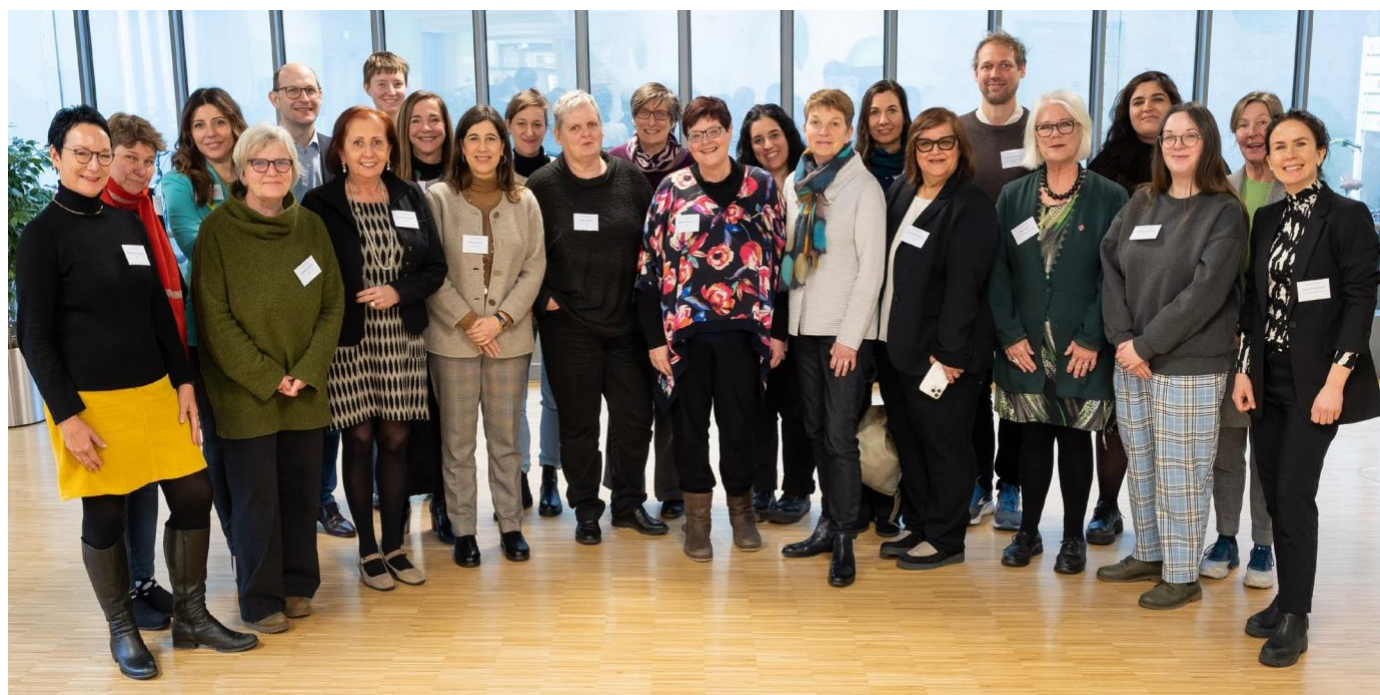
Foto di gruppo del consorzio del progetto VIPROM: 23 partner hanno partecipato alla riunione di avvio presso l'Università di Münster in Germania.

Durante l'incontro di avvio, che si è tenuto dal 28 febbraio al 1° marzo, i partner del VIPROM si sono concentrati sulla discussione della struttura generale del lavoro, del calendario e degli obiettivi del progetto. Grazie alla partecipazione di molti esperti provenienti da diversi gruppi professionali, come universitari di medicina, professionisti ospedalieri, ricercatori, formatori e organizzazioni per la protezione delle vittime, si è discusso intensamente su come trasferire le conoscenze. I partecipanti si sono subito trovati d'accordo sul fatto che il progetto VIPROM può solo perseguire un approccio trasversale per trovare soluzioni che soddisfino le esigenze di tutte le vittime. Pertanto, il progetto VIPROM mira a seguire un approccio partecipativo e culturalmente sensibile, perchè questo è fondamentale per sostenere i programmi di intervento a lungo termine. Inoltre, l'Università di Münster ha dato ai partner l'opportunità di partecipare a una formazione pratica per avere un'idea dei suoi programmi di simulazione. Maggiori informazioni su questo interessante argomento a pagina 5 .